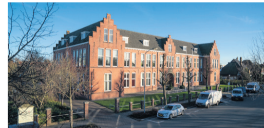
Gemeentehuis Appingedam Wilhelminaweg 14 9901 CM Appingedam