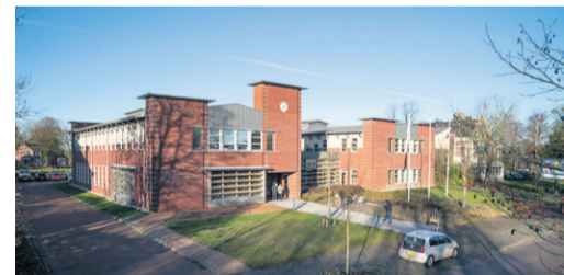
Gemeentehuis Loppersum Molenweg 12 9919 AH Loppersum

Vanwege het coronavirus werken wij op dit moment alleen op afspraak. Voor het maken van een afspraak kunt u bellen met 14 05 96