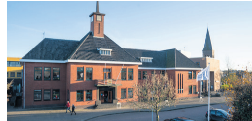
Gemeentehuis Delfzijl Johan van den Kornputplein 10 9934 EA Delfzijl

Vanwege de maatregelen tegen verdere verspreiding van het coronavirus, kunt u alleen voor noodzakelijke onderwerpen terecht in een van de gemeentehuizen. Het is hierdoor niet mogelijk om de aanvragen, besluiten en bijbehorende stukken in te zien. Mocht u toch een stuk willen inzien, neem dan contact op met het Klant Contact Centrum (KCC) via telefoonnummer 14 05 96. De medewerkers van het KCC gaan met u op zoek naar een oplossing.